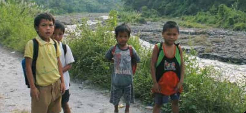
Kinderen op weg naar school.